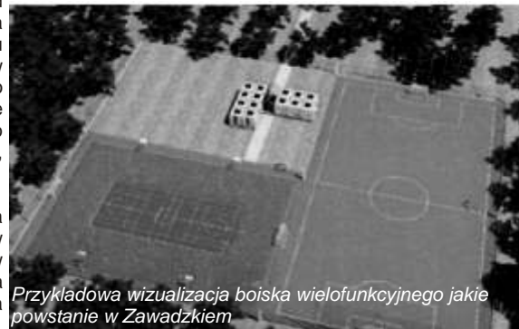
Przykładowa wizualizacja boiska wielofunkcyjnego jakie powstanie w Zawadzkim