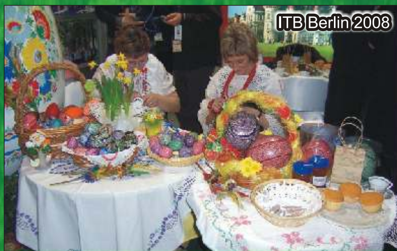
ITB Berlin 2008

dowicka szkoła jest enklaw kulturowania gwary i tradycji I skich. Ju po raz jedenasty odbywał si w Zespole Szkolno Gimnazjalnym Gminny Konkurs Gwary I skiej,, I skie Beranie”.