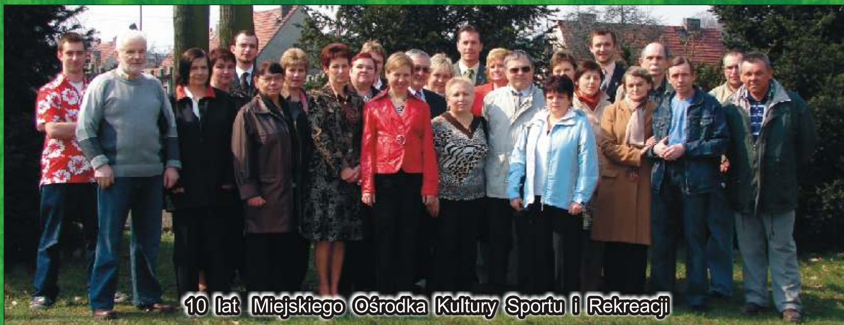
10 lat Miejskiego Ośrodka Kultury Sportu i Rekreacji